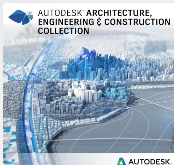
Autodesk AEC Collection