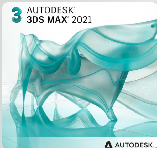
Autodesk 3ds Max