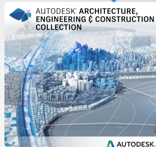
Autodesk AEC Collection

Sisaldab 50+ tarkvara seejuures ka Civil 3D ja Infraworks