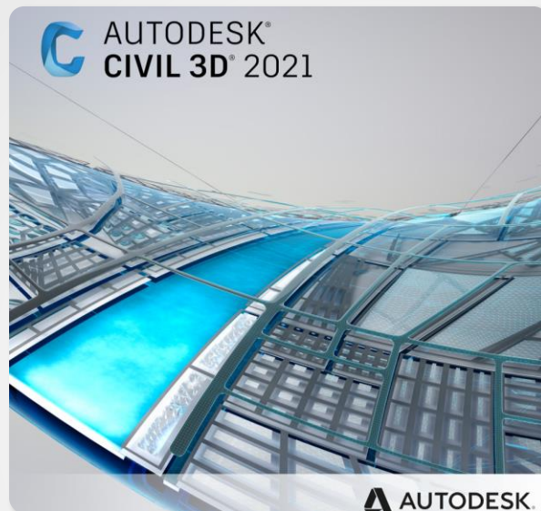
Autodesk AutoCAD Civil 3D